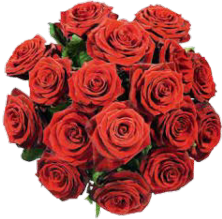
↑ Rund gebundener Strauß aus edlen roten Rosen

menschen. Dabei ist es ganz gleich, wen Sie dazu zählen: ob Ihre beste Freundin, Ihren besten Freund, Ihr Enkelkind oder Ihren Partner. Der Valentinstag ist der Tag der Liebenden und die Liebe kennt ja bekanntlich keine Grenzen.