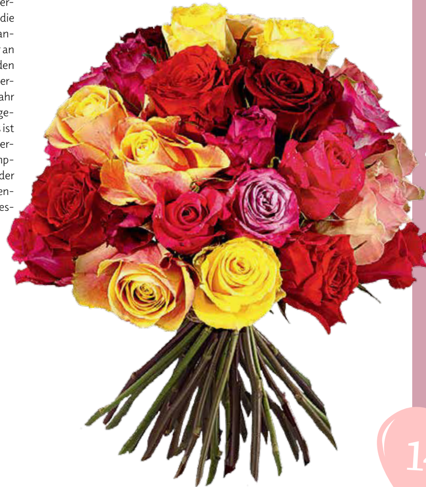
↑ Rund und kompakt gebundener farbenfroher Strauß aus großköpfigen Rosen ohne Beiwerk