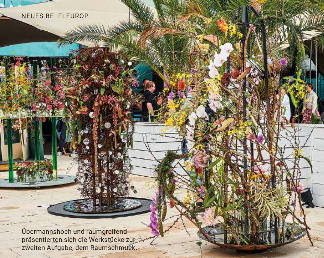
Übermannshoch und raumgreifend präsentierten sich die Werkstücke zur zweiten Aufgabe, dem Raumschmuck.