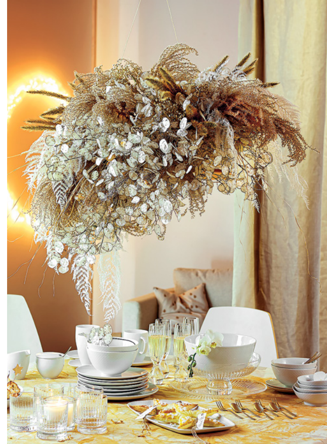
LINKS: Wie eine üppige Wolke schwebt das Gesteck aus Lunaria , Chinaschilf, Hirse und getrocknetem Farn über der festlich gedeckten Tafel und rundet das Ambiente ab.

Mondviole, Silbertaler, Nachtviole oder Judas-Silberling – das Silberblatt ( Lunaria annua ) ist unter vielen verschiedenen Namen bekannt. Dabei sind es die silbrig-glänzenden Samenstände in Taler- oder Mondform, die der Pflanze ihren Namen geben. Und natürlich ist auch die botanische Bezeichnung Lunaria nicht ganz unschuldig daran. Immerhin leitet sie sich von dem lateinischen Wort „luna“ für „Mond“ ab. Doch egal, wie man die zarte Pflanze auch nennen mag, sie zieht gerade in der kalten Jahreszeit mit ihren semitransparenten Scheidenblättern, die wie pergamentartige, filigrane Taler wirken, alle Blicke auf sich.