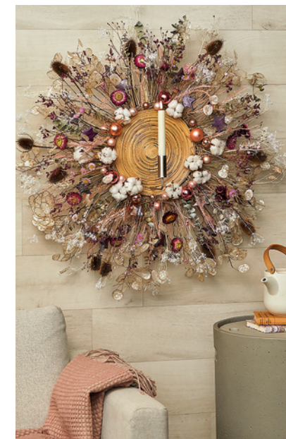
OBEN: Strahlenförmig sind Silberblattzweige, Strohblumen, Weber-Karden, Eukalyptus und Trockenblumen in die Furnierscheibe eingearbeitet. Sie bilden mit der Kerze einen stimmungsvollen Wandschmuck.

Die Staude gehört zur Familie der Kreuzblütler und kommt ursprünglich aus dem europäischen Mittelmeerraum, wo sie überwiegend in der Nähe von Gewässern wächst. Mittlerweile ist sie aber fast in ganz Europa heimisch. Je nach Sorte und Witterung bringt sie zwischen April und Juni weiße oder violette Blüten hervor. Dabei verströmt sie besonders nachts einen wohlriechenden Duft und lockt so vor allem Bienen und Schmetterlinge an. Zudem wächst das Silberblatt krautig und aufrecht und erreicht eine Höhe von etwa einem Meter sowie eine Breite von etwa 30 Zentimetern. Es fühlt sich an einem absonnigen bis halbschattigen Standort mit sandigem oder lehmigem Boden äußerst wohl. Die Blätter sind hellgrün und herzförmig. Sie können bis zu 15 Zentimeter lang werden. >>